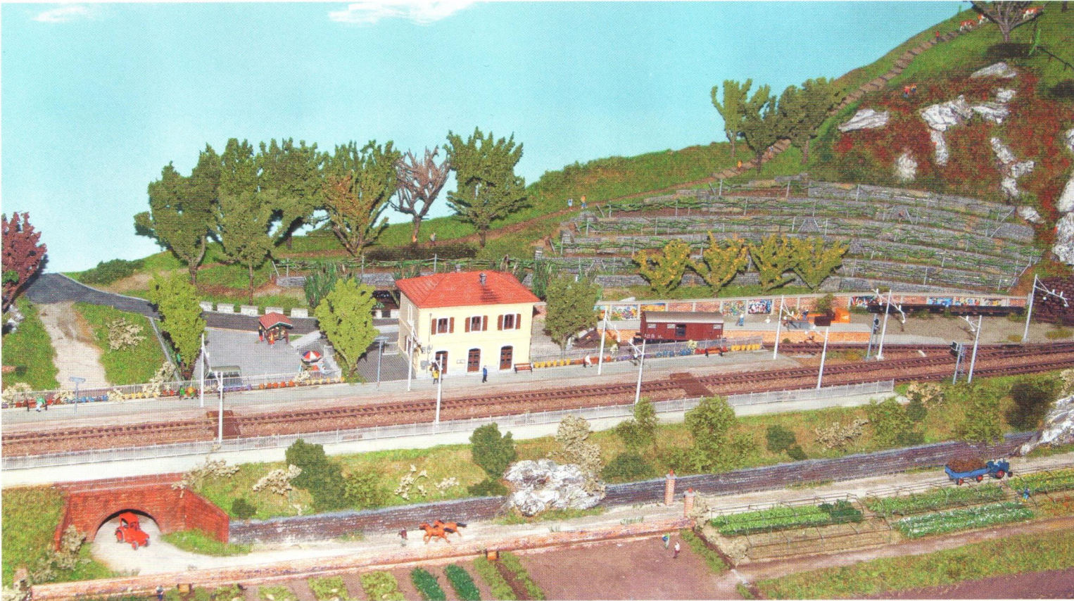
Ein kleiner Bahnhof mit einem Gütergleis inmitten kultivierter Landschaft zeigt dieses italienische Modul.

■ Impressionen von der 9. European N-Scale Convention 2014