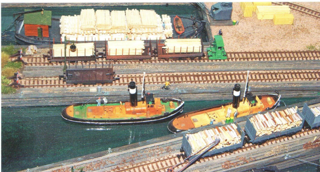
Ein Kopfbahnhof mit Holzumschlag zwischen Bahn und Schiff ist das Thema dieses finnischen Segments.

Der diesjährige Herbst war mit einer Reihe von Modellbahnmessen in Deutschland, der Schweiz und Österreich bedient. Für den Modellbahner in der Baugröße N stand die Modellbau Süd in Stuttgart im Vordergrund.